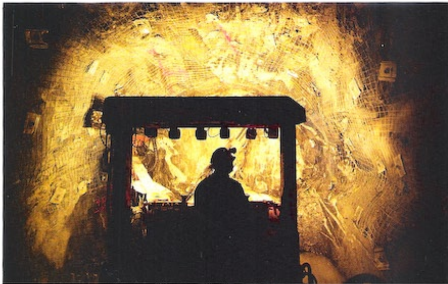
Aranybánya. Keményen dolgozhatnak a bányászok az aranybányákban. A sárga nemesfém ugyanis az idén a befektetők egyik kedvence. Az is előfordult, hogy hiánycikké vált a befektetési arany a kereskedőknél

kibocsátott 2009. évi érmekollekcióra négy nap alatt szintén rekordnagyságú, csaknem 300 ezer megrendelés érkezett, ez 8,3 millió dolláros bevételt hozott.